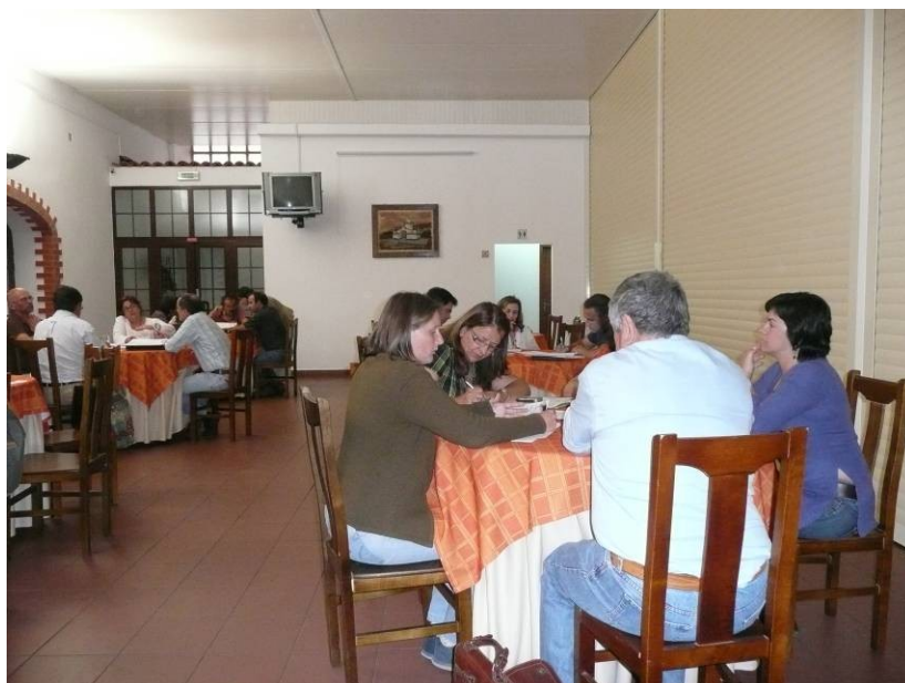
Figura 5. Exemplo de trabalho em sub-grupos

Segue-se uma descrição das tarefas efectuadas e um sumário dos resultados obtidos por tarefa. Foram incluídas nas tabelas apresentadas apenas as designações e/ou resumos dos conteúdos que os grupos incluíram nas fichas de trabalho. Os conteúdos originais utilizados para elaborar estes quadros podem ser consultados na íntegra no anexo a este relatório.