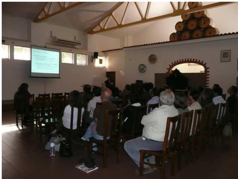
Figura 6. Sessão plenária final

Na próxima secção apresentam-se os resultados da avaliação do workshop pelos participantes.